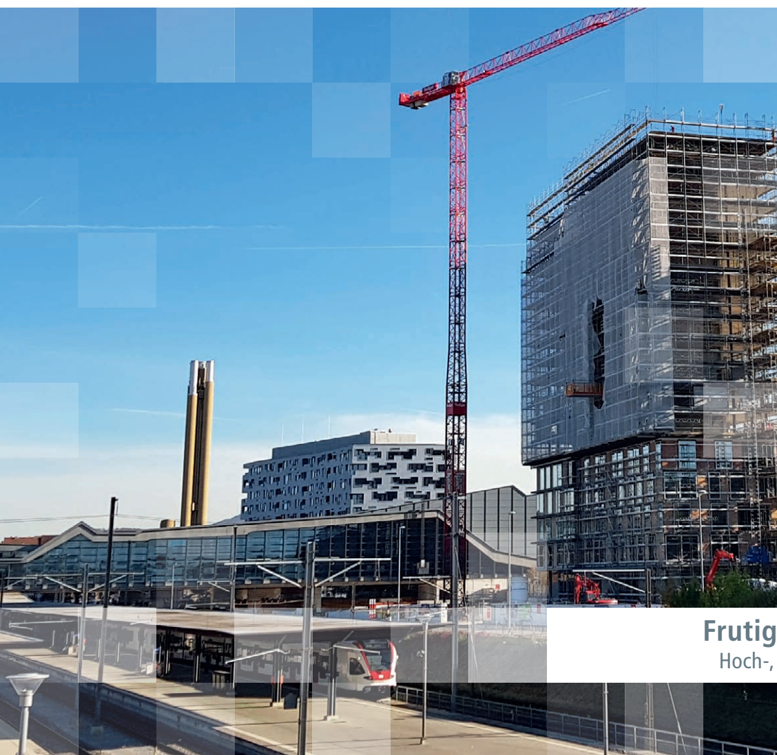
Frutiger AG Basel Hoch-, Tief- und Umbau